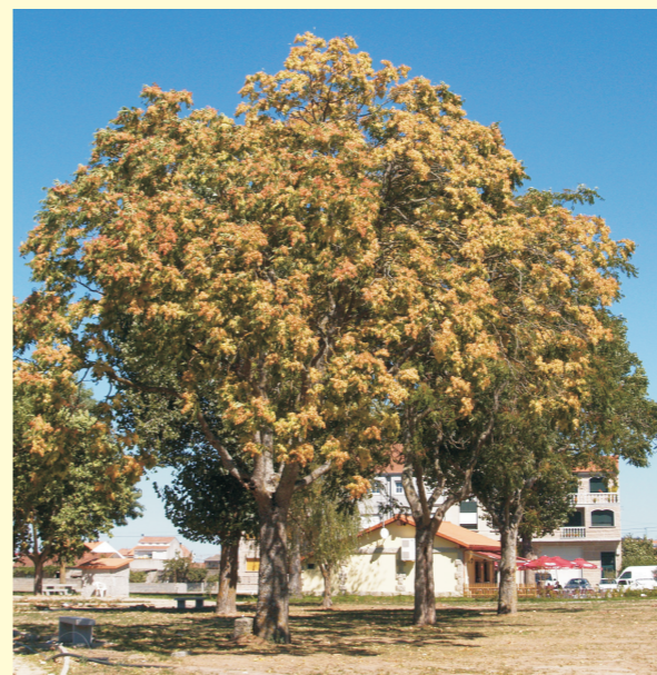
Ailanto cos froitos maduros. Xinzo de Limia..