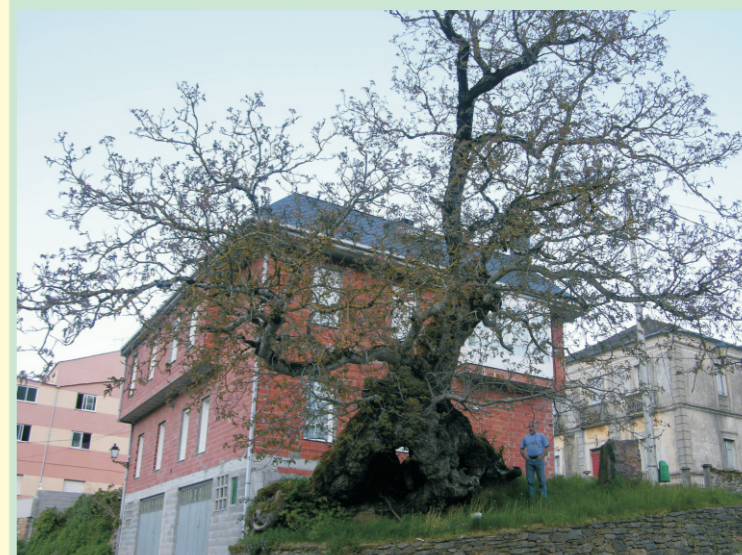
Nogueira de Triacastela (Lugo). O toro mide 7,40 m de contorno a 1,30 m de altura. Na base é moito máis groso.

Os froitos son drupas carnosas de forma globular, de 4-5 cm de lonxitude, coa superficie lisa e de cor verde con pencas craras. A semente (noz) é grande e ten unha cuberta leñosa, enrugada e de cor castaña crara