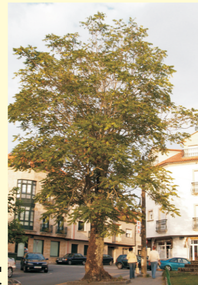
Ailanto da Carballeira de Cambados.

O ailanto compórtase como unha especie invasora porque rebrota facilmente de raíz.