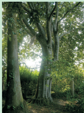
Loureiro do Pazo de Fefiñáns

Os froitos son bagas de forma oval, (1,5 cm. de lonxitude aprox,) cor negra e cunha soa semente.